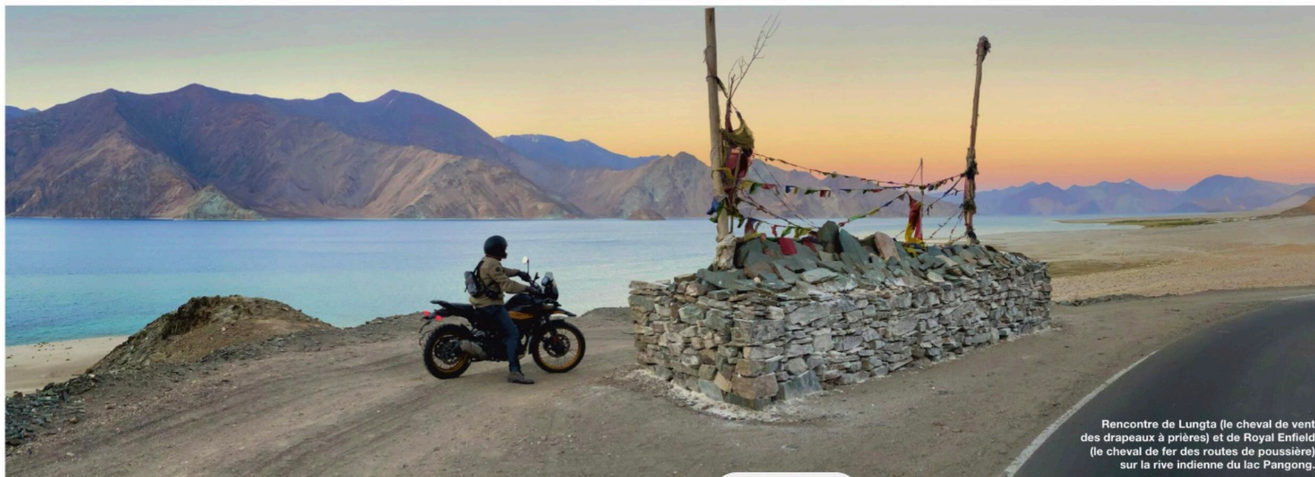
Rencontre de Lungta (le cheval de vent des drapeaux à prières) et de Royal Enfield (le cheval de fer des routes de poussière) sur la rive indienne du lac Pangong.

Les pistes s'enroulent dans la jungle. Les najas en font autant. Des cathédrales de nuages s'appuient sur les versants. Dans un mois, la mousson lavera le subcontinent. Tout sera pardonné et tout pourra reprendre. La chaleur englué la pensée. Il faut frayer dans l'air comme on pénètre une matière. En Inde, l'Occidental étouffe. Débarqué de son potager, il a l'impression qu'un éléphant cosmique s'est assis sur son cœur. On lit Michaux le soir, pour se fouetter l'esprit. Il fut certes sévère avec les Hindous. C'est qu'il admirait le peuple le plus profond du monde. En Inde, quelle importance si l'on ne répond pas à vos désirs dans cinq minutes puisque tout sera accompli dans un millénaire ou deux. Il faut voyager avec politesse. Ne rien