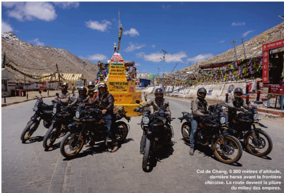
Col de Chang, 5 300 mètres d'altitude, dernière herse avant la frontière chinoise. La route devient la pliure du milieu des empires.