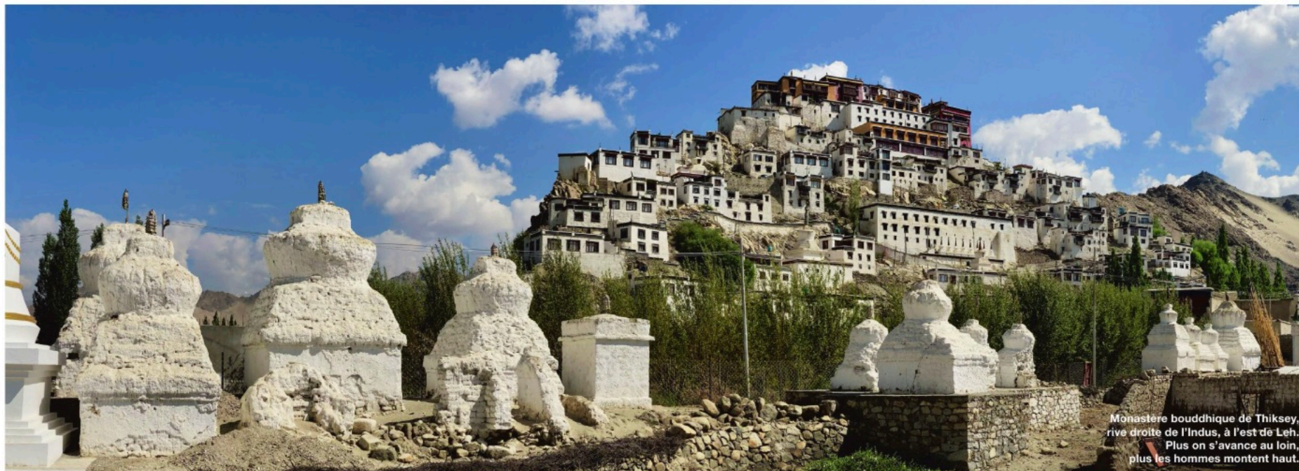
Monastère bouddhique de Thiksey, rive droite de l'Indus, à l'est de Leh. Plus on s'avance au loin, plus les hommes montent haut.