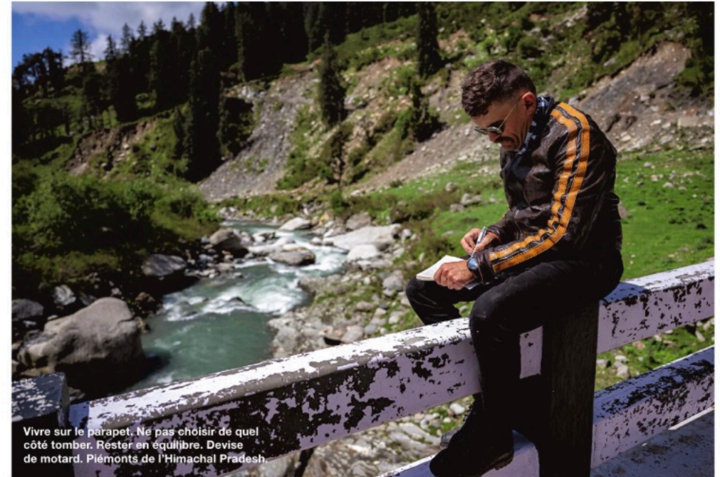
Vivre sur le parapet. Ne pas choisir de quel côté tomber. Rester en équilibre. Devise de motard. Piémonts de l'Himachal Pradesh.