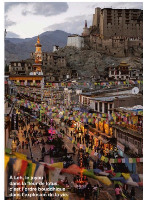
À Leh, le joyau dans la fleur de lotus, c'est l'ordre bouddhique dans l'explosion de la vie.