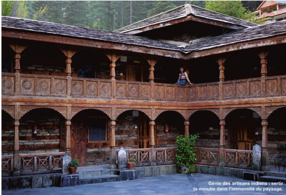
Génie des artisans indiens : serrer la minutie dans l'immensité du paysage.