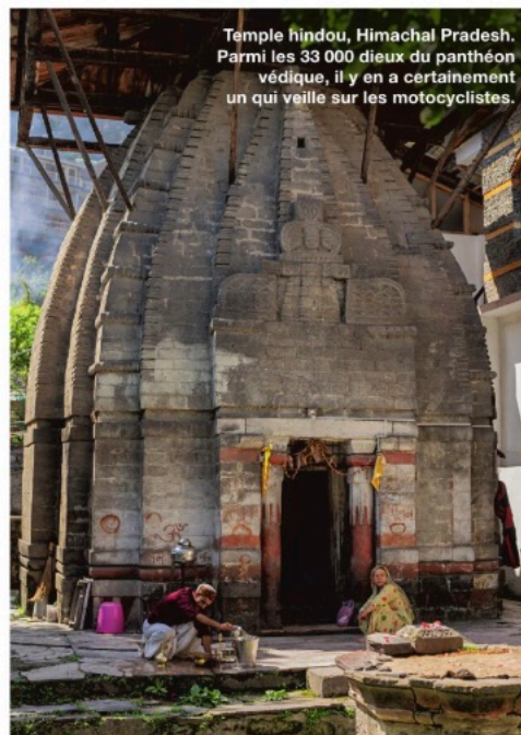
Temple hindou, Himachal Pradesh. Parmi les 33 000 dieux du panthéon védique, il y en a certainement un qui veille sur les motocyclistes.