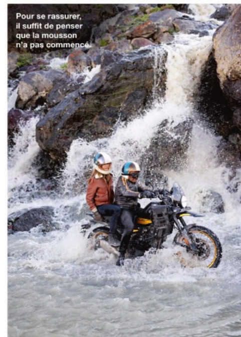
Pour se rassurer, il suffit de penser que la mousson n'a pas commencé.