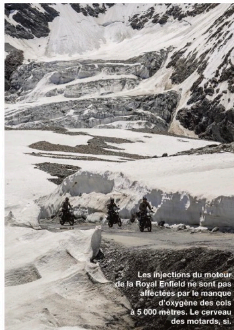
Les injections du moteur de la Royal Enfield ne sont pas affectées par le manque d'oxygène des cols à 5 000 mètres. Le cerveau des motards, si.

Les voyages sont effectués à bord de modèles de caractère Royal Enfield (Bullet 500cc ou Himalayan 450cc). Pour réaliser la Transhimalayenne, comme l'a fait Sylvain Tesson, compter 2 990 € par pilote (ce prix ne comprend pas les vols internationaux pour se rendre en Inde). Renseignements : vintagerides.com . Contact : teamvr@vintagerides.com